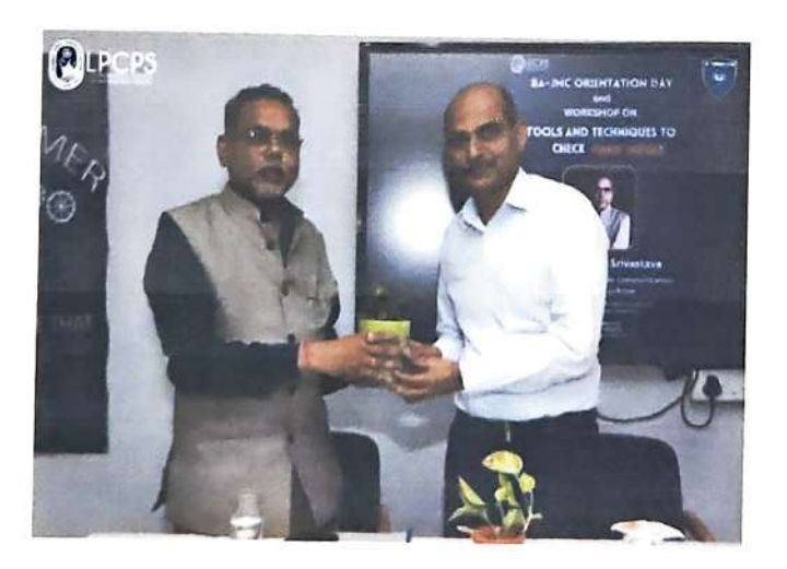
Principal Lucknow Public College of Professional Studies Vinamra Khand, Gomtinagar, Lucknow

इसके बाद कार्यशाला में फर्जी खवरों की पहचान करने के लिए व्यावहारिक उपकरणों और तकनीकों पर ध्यान केंद्रित किया गया। वक्ता ने विभिन्न ऑनलाइन संसाधनों और तथ्य-जाँच वेबसाइटों की शुरुआत की जिनका उपयोग जानकारी को सत्यापित करने के लिए किया जा सकता है। प्रतिभागियों को यह भी सिखाया गया कि स्रोतों की विश्वसनीयता का आकलन कैसे करें, पूर्वाग्रहों की पहचान करें और जानकारी में विसंगतियों का पता कैसे लगाएं। कार्यशाला का समापन व्यावहारिक अभ्यास के साथ हुआ जहां प्रतिभागियों को समाचार लेखों और सोशल मीडिया पोस्ट का विश्लेषण और मूल्यांकन करने के लिए कहा गया। उन्हें संभावित लाल झंडों की पहचान करने और जानकारी को सत्यापित करने के लिए तथ्य-जांच उपकरणों का उपयोग करने की प्रक्रिया के माध्यम से निर्देशित किया गया था।