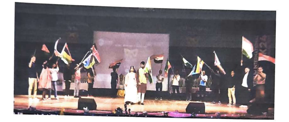
Principal Lucknow Public College of Professional Studies Vinamra Khand, Gomtinagar, Lucknow