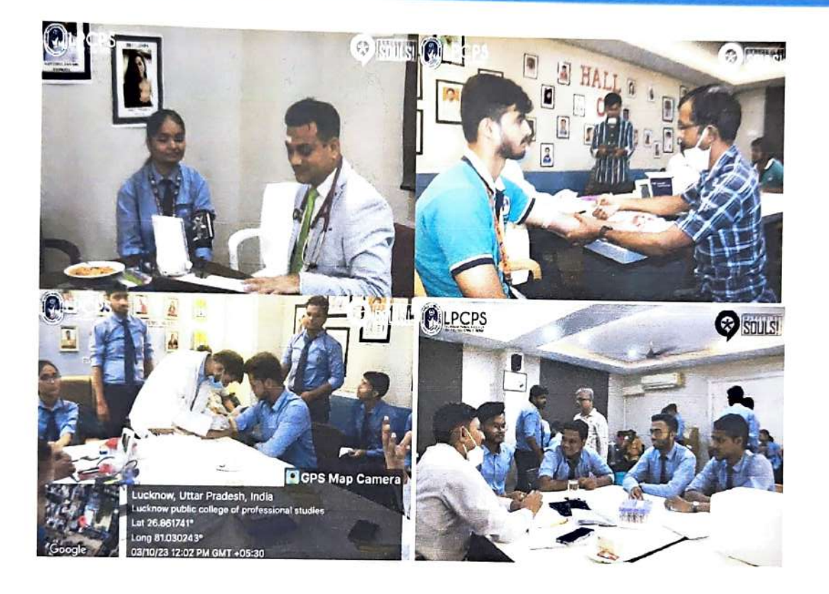
Principal Lucknow Public College of Professional Studies Vinamra Khand, Gomtinagar, Lucknow